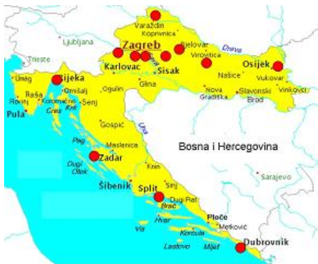
Slika 1. Lokacija mjernih postaja za uzorkovanje peluda u Republici Hrvatskoj

Svakodnevnim određivanjem peludnog broja i determiniranjem vrsta peluda prati se dinamika njegovog pojavljivanja. Peludni kalendari uvijek se izrađuju za proteklu peludnu sezonu i razlikuju se od godine do godine, s obzirom na vremenske prilike. Temperatura i oborine su meteorološki parametri koji najviše utječu na dinamiku pojave peluda u zraku. Naglo zatopljenje potaknut će početak stvaranja i otpuštanja peluda u atmosferu, a u vrijeme oborina gotovo da ga i nema u zraku.