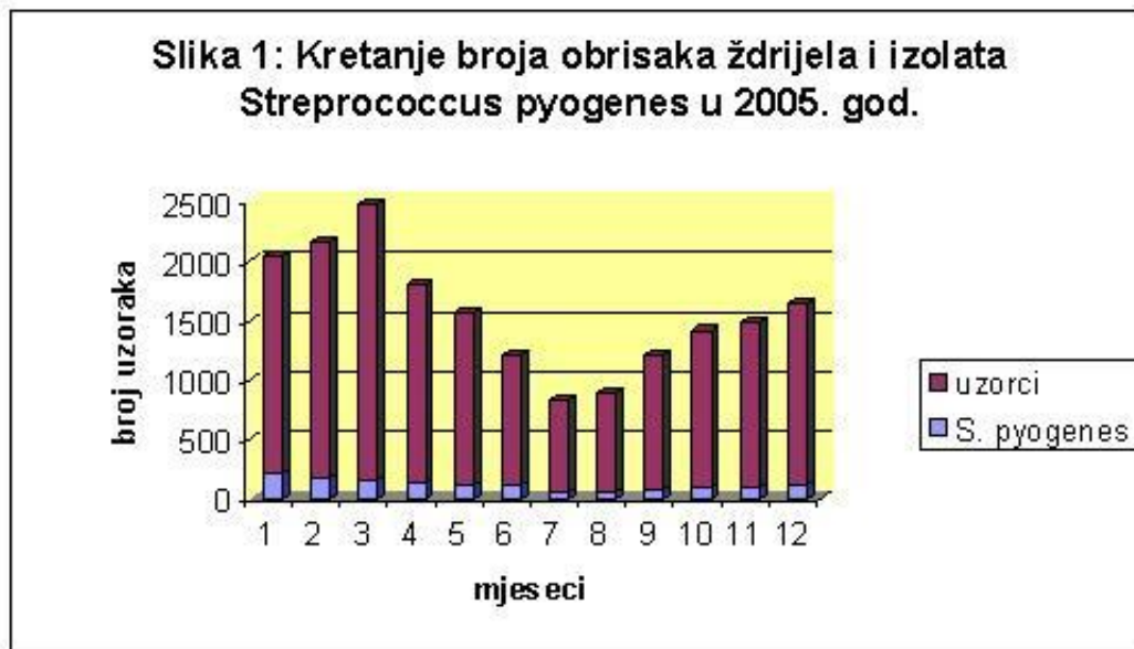
Slika 1: Kretanje broja uzoraka obriska ždrijela i izolata Streptococcus pyogenes u 2005. god. (Ukupno je obrađeno 18.694 uzorka, među kojima je bilo 1.392 izolata Streptococcus pyogenes)

zadovoljavajuća, iako je naša želja da bude još bolja. Naime, pod pojmom «klinički mikrobiolog», obično se podrazumijeva bolnički specijalist, ali, uz dobru suradnju moguće je u primarnoj zdravstvenoj zaštiti postići odlične rezultate, što je i naš cilj.