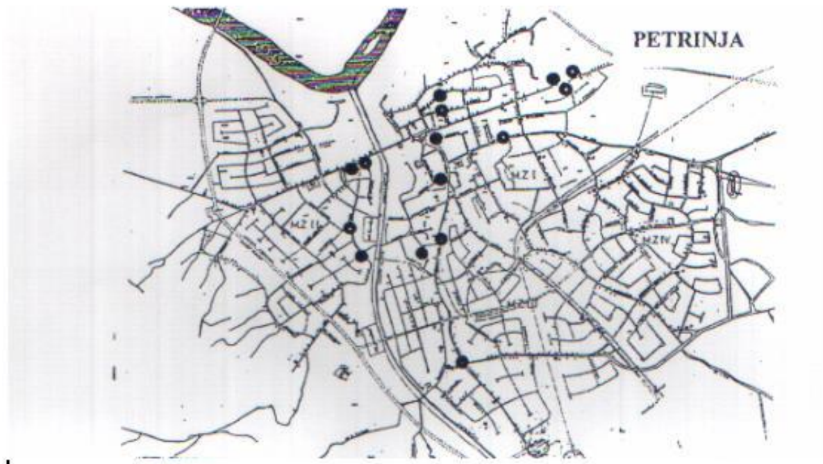
Sl. 1. Tlocrt Petrinje s pojedinačno obilježenim slučajevima oboljenja