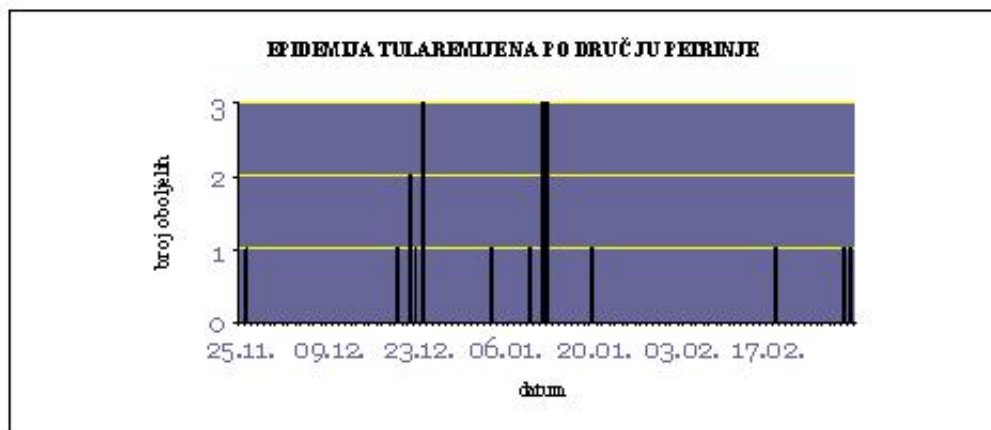
Grafikon 1. Epidemija tularemije na području Petrinje

Kao što je vidljivo iz grafikona 1, prva epidemija tularemije "vuče se" tri mjeseca: počela je krajem studenoga 1998. i završila početkom ožujka 1999. s nešto značajnijim grupiranjem u drugoj polovici prosinca i prvoj polovici siječnja.