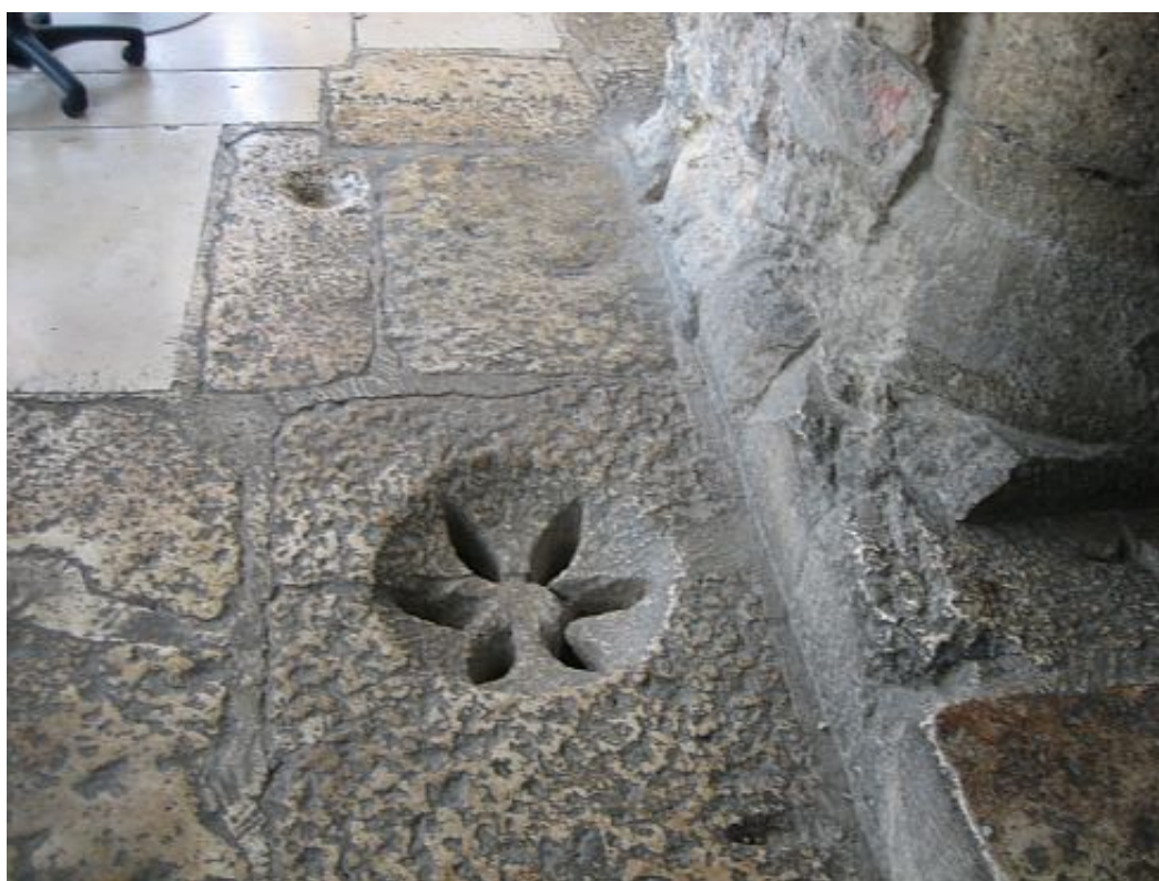
Slika 4. Kamena rozeta na šahti kanalizacijske mreže