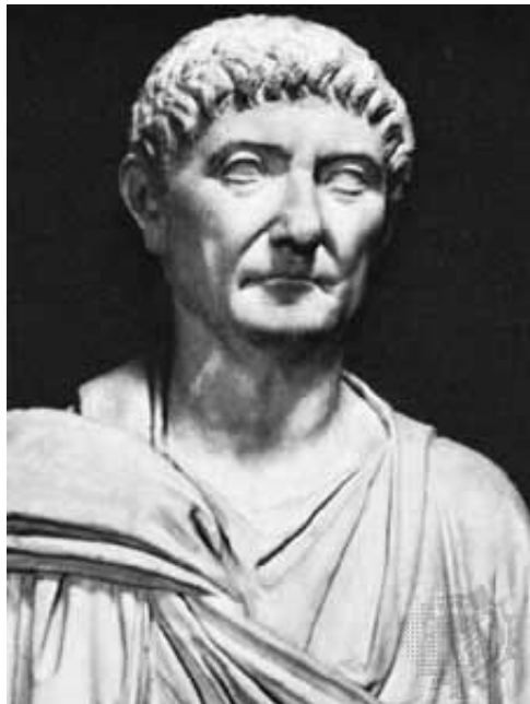
Slika 1. Car Dioklecijan