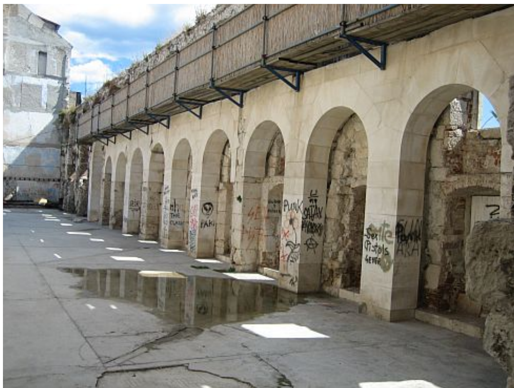
Slika 3. Cryptoporticus-natkrito zaštićeno šetalište