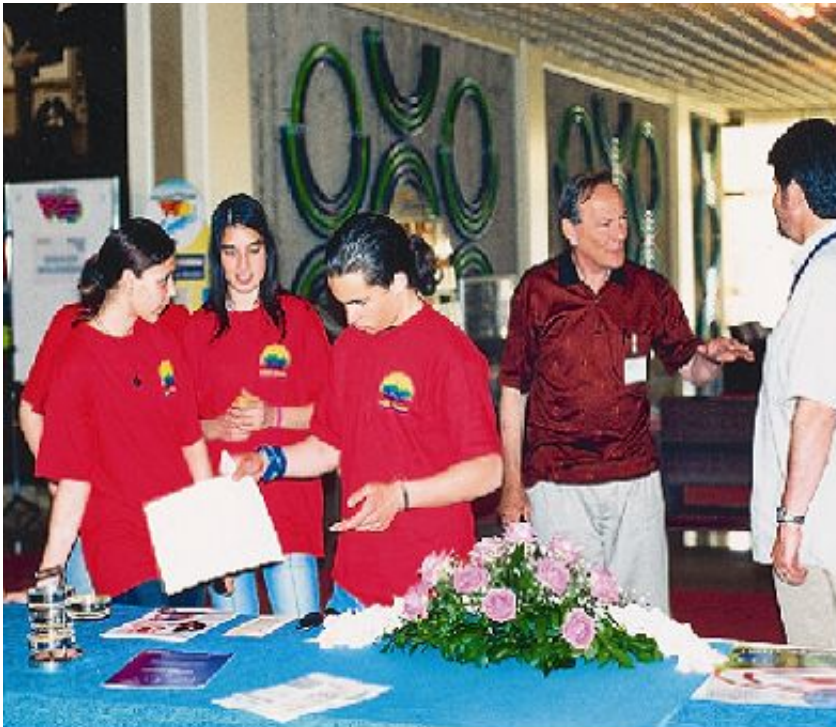
Mladi volonteri na 1. ALPE ADRIA konferenciji o ovisnostima

U Savjetovaništu «Zdravog grada» provode se individualni, obiteljski i grupni oblici savjetovanja i psihoterapije.