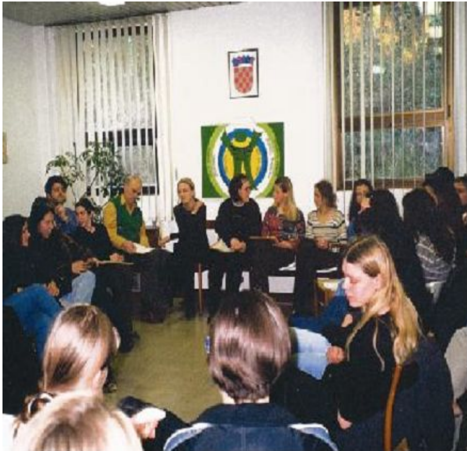
Parlaonica na temu ovisnosti za mlade i roditelje

U Povjerenstvu je imenovan i poseban Tim za evaluaciju od 5 članova koji ima zadatak pratiti ishode i evaluirati postignuća pojedinih programa.