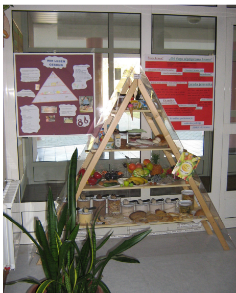
Piramida pravilne prehrane u holu OŠ Štrigova

Model piramide pravilne prehrane postavljen je u holu osnovne škole Štrigova. Kao takav izazvao je pozornost i zanimanje učenika, roditelja i posjetitelja koji tako mogu sustavno dobivati informacije o pravilnoj prehrani. Piramida je bila prikazana u mjesečniku za popularizaciju prirodnih znanosti i ekologiju "Priroda".